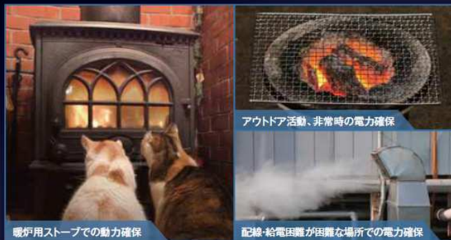
様々なシチュエーションで排熱等を利用、いろいろな用途に応用出来ます。